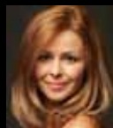
D. Šimková školička

Informace na bezplatné lince +420 800 100 296