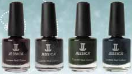
645 Midnight Mist 644 Black Ice 643 Divine Pine 642 Frost At All Cost